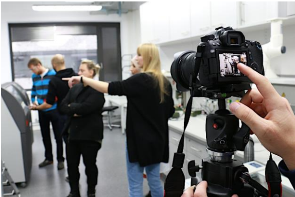
Umsetzung audiovisueller Projekte

Die Digitalisierung revolutioniert die Industrieproduktion zur Industrie 4.0., ganze Geschäftsmodelle verschwinden und neue entstehen, Kundinnen und Kunden agieren in der digitalen Welt. Auch das Marketing revolutioniert sich selbst.