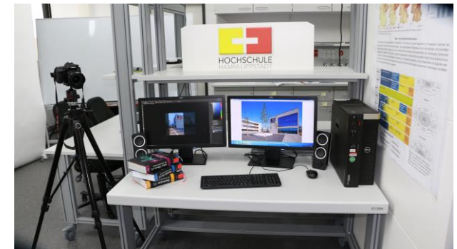
Arbeitsplatz im CML

Hierbei werden Sie von den studentischen Hilfskräften und wissenschaftlichen Mitarbeitern der HSHL betreut.